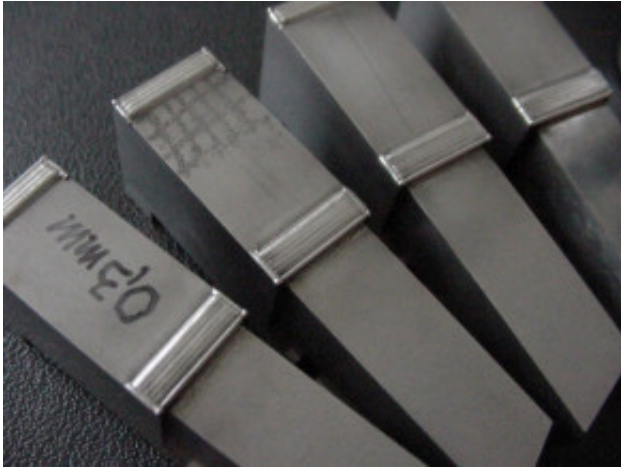
Stabwerkzeuge Schweißzusatz DM 0,3 mm