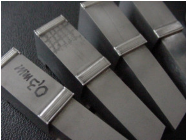
Enchimento barra de ferramenta de solda diametro 0,3